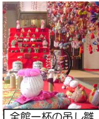
全館一杯の吊し雛