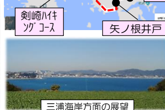
三浦海岸方面の展望